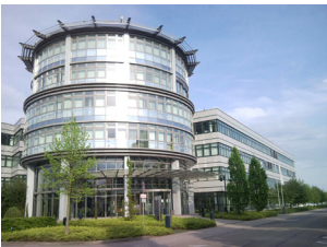
SAP Partner-Port Walldorf