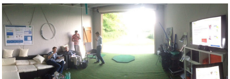
Golfanlage Hohenhardter Hof